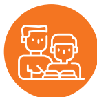
опекун или попечитель