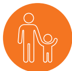
один из родителей

В отношении детей заявление о применении мер защиты может направить в суд: